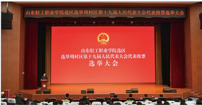
山东轻工职业学院周村区第十九届人民代表大会代表投票选举大会