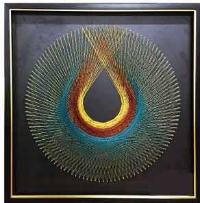
田春婷 唐楚意 赵永琪作品